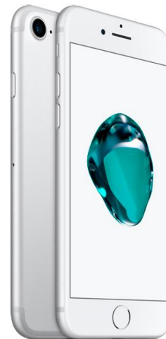
Apple iPhone 7 «Как новый»