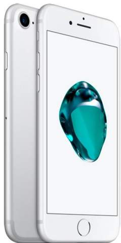
Apple iPhone 7

Про новый айфон вы и сами всё знаете – это отличная неприхотливая техника, которая всегда в моде, что же такое iPhone «как новый»? – Это гаджет, который раньше уже активировался, после чего прошел заводскую процедуру восстановления и выглядит, как новый, но стоит до 30% дешевле нового.